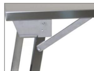
Part. staffa e sostegno