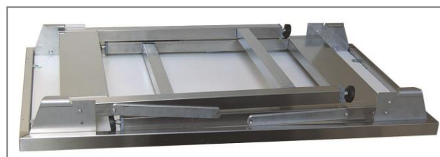
Part. tavolo chiuso