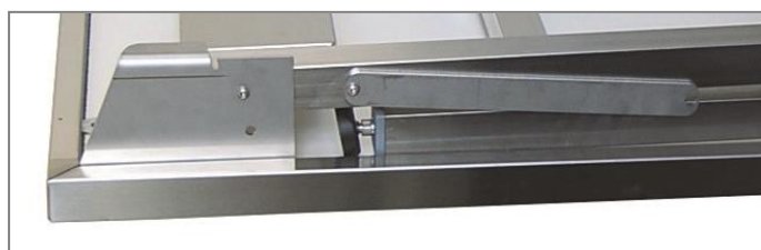
Part. meccanismo di chiusura

Realizzato in acciaio inox AISI 304 ed AISI 430 per alcune parti di secondaria importanza e per le quali non è previsto il contatto con gli alimenti • Piano di lavoro in acciaio inox AISI 304 h. 40 mm. tamburato e insonorizzato • Ideale per tutti i tipi di catering, manifestazioni, banchetti o buffet e per tutte le occasioni in cui è necessario smobilitare velocemente una postazione • Chiudibile in pochi secondi occupando un minimo ingombro • Gambe in tubolare quadro (mm.40x40) dotate di piedini di livellamento • Possibilità d'inserimento ruote • Realizzabile su misura.