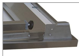
Part. piedini e angolo